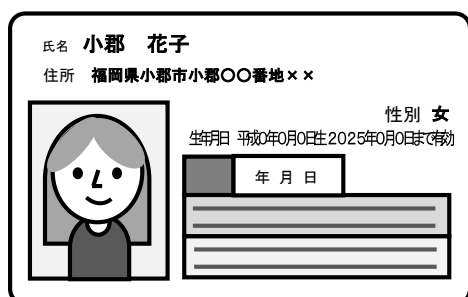
↑個人番号カード(表)の見本