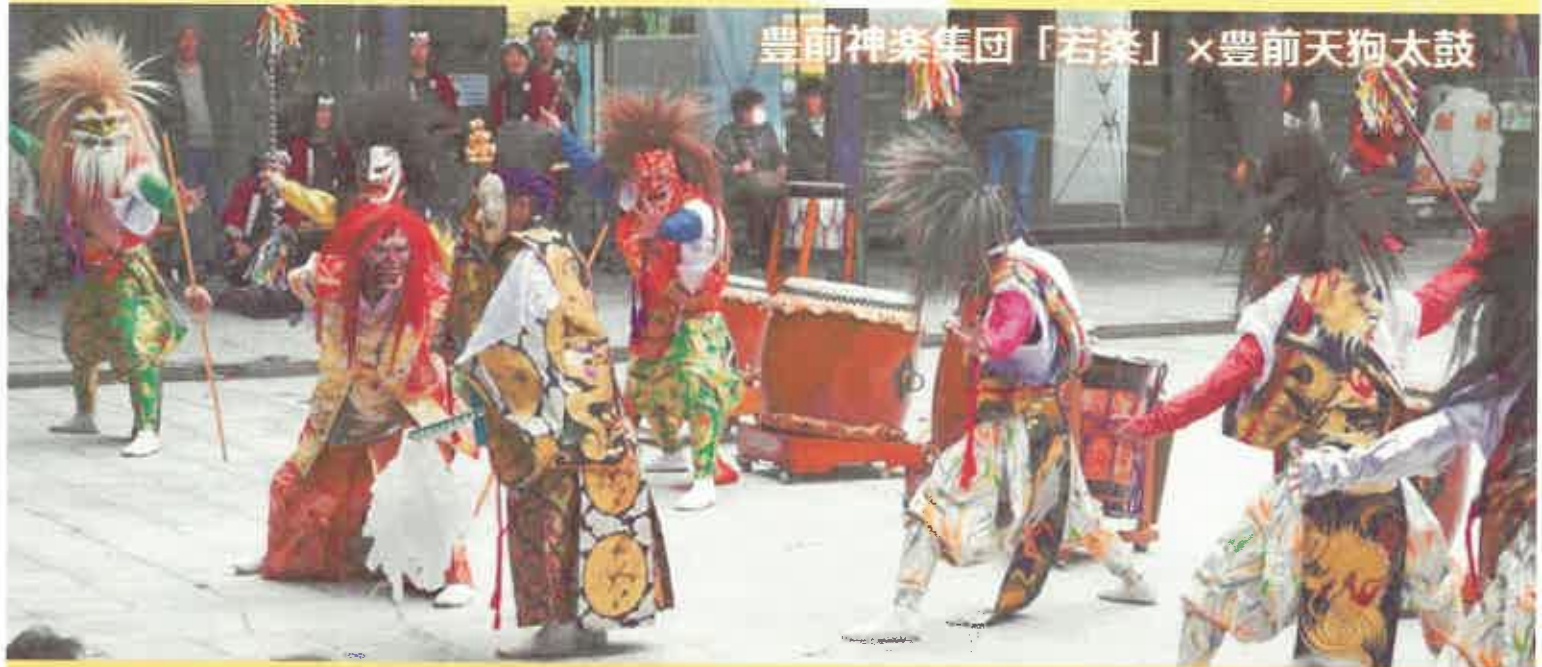
豊前神楽集団「若楽」×豊前天狗太鼓