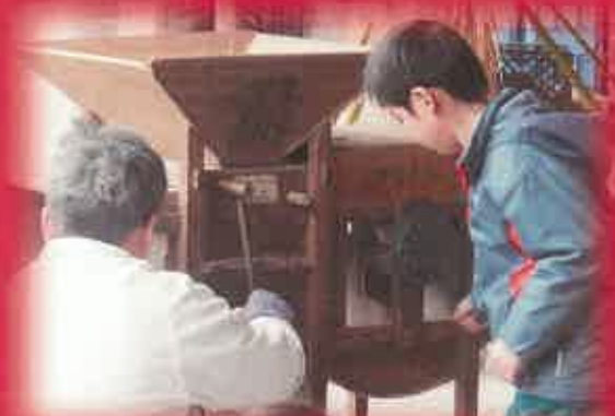
唐箕で選別を試みたり…