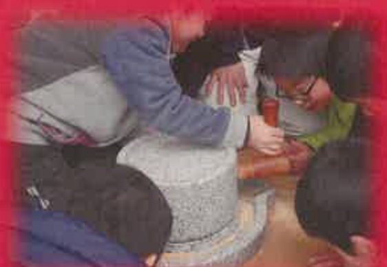
石臼で大豆を粉にしてみたり…