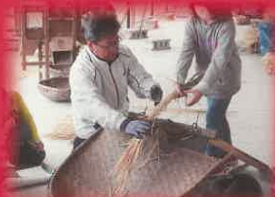
千歯扱きで稲の脱穀を試みたり…