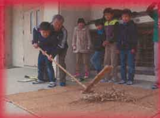
振り子で大豆の脱穀を試みたり…