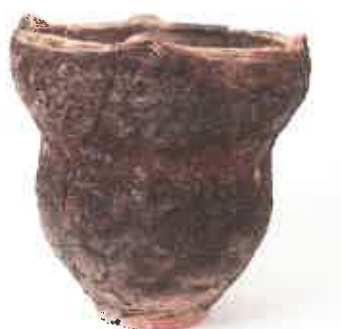
みやこ町下伊良原竹の内遺跡 出土縄文土器