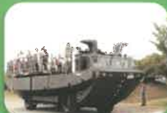
水陸両用車等の体験試乗