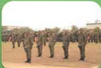
観閲式・観閲行進

式典・観閲行進・災害対処訓練展示・装備品の体験と展示 自衛隊の魅力を体感してください！