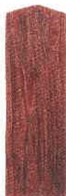
筑後市彼岸田遺跡出土 呪符木簡

問合せ先 担当課：九州歴史資料館 担当者名：秦憲二・峯大志 連絡先：0942-75-9501