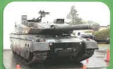
10式戦車等の装備品展示