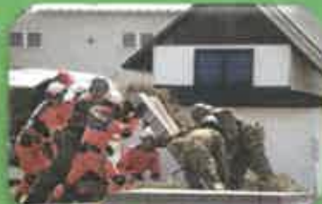
各機関合同での訓練展示