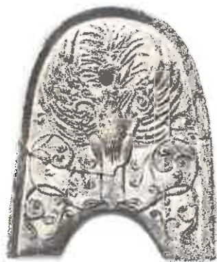
平城宮(内裏)跡出土鳳凰文鬼瓦

無料：展示室を観覧する場合は有料、一般200(150)円 高大生150(100)円、中学生以下、満65歳以上の方、障がいのある方とその介護者1名無料(土曜日は高校生も無料)※( )内は、20名以上の団体料金。