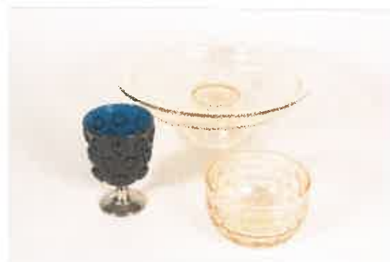
シルクロードを通じてもたらされたガラス杯・高杯・椀(模造)