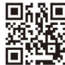
▲クリーンヒル宝満