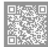
▲環境省データベース

故人が犬を飼っていた場合、生活環境課にて飼い主変更の手続きをしてください。 マイクロチップを装着し、環境省データベースに登録している場合は、 環境省データベースにて飼い主変更の手続きをしてください。