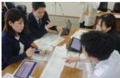
【立石中校区グループの協議の様子】

5つの中学校区グループに分かれ、右のような協議シートを使って協議を行いました。今年度は、各中学校区における目指す子ども像を統一しているため、小・中9年間の子どもの学びの連続性を意識しながら、各中学校の自己調整に係る実態・課題・要因を基にした取組(案)を考えていきました。