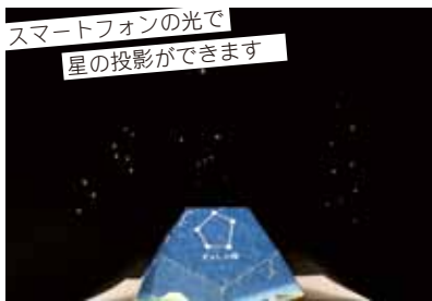
スマートフォンの光で 星の投影ができます

1995年、福岡県生まれ。広島市のこども文化科学館での勤務歴があり、子ども向けの天体教室・観測会に関わる。趣味は読書、チェス、将棋。好きな太陽系惑星は海王星で、未だ謎多き深い青の惑星に魅力を感じます。