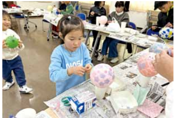
和紙のことを学びました