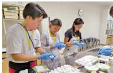
にほん ぶんかたいけん さんか 日本の文化体験イベントへの参加