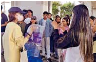
ひろ ぶんべつたいかい ごみ拾い・分別大会