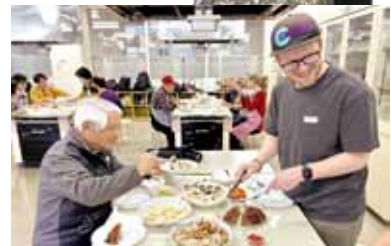
ちいき ひと たこせきりょうりきょうしつ 地域の人への多国籍料理教室