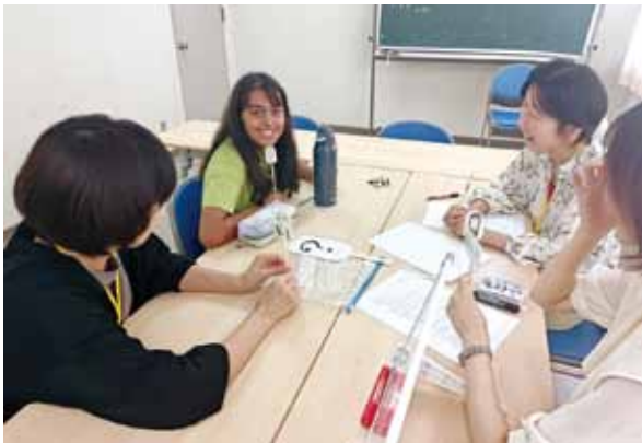
楽しく日本語を勉強しています