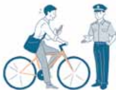
小郡警察署管内の犯罪・交通事故の発生状況 (令和6年9月末現在)