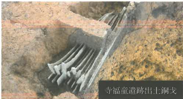
寺福童遺跡出土銅戈

弥生時代には、朝鮮半島から稲作や青銅器が伝来し、それらに関わる祭祀(マツリ)も始まりました。今回の特別展では、再修復された多鈕細文鏡(国指定重要文化財)を中心に、市内外の遺構や遺物から当時のマツリの様子を探っていきます。