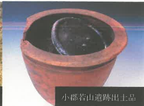
小郡若山遺跡出土品

会 期 9月14日(土)～12月14日(土) 時 間 9時～16時30分(入館16時まで) 会 場 埋蔵文化財調査センター 展示室 入 館 料 無料 休 館 日 9月15日(日)・17日(火)、10月20日(日)・21日(月)、 11月17日(日)・18日(月)