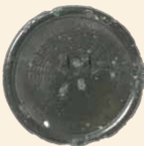
小郡若山遺跡・青銅鏡

行い、令和6年3月に小郡市に戻ってきました。普段はレプリカを展示していますが、特別展では本物を展示します。