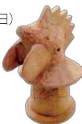
▲今城塚古墳 鶏形埴輪