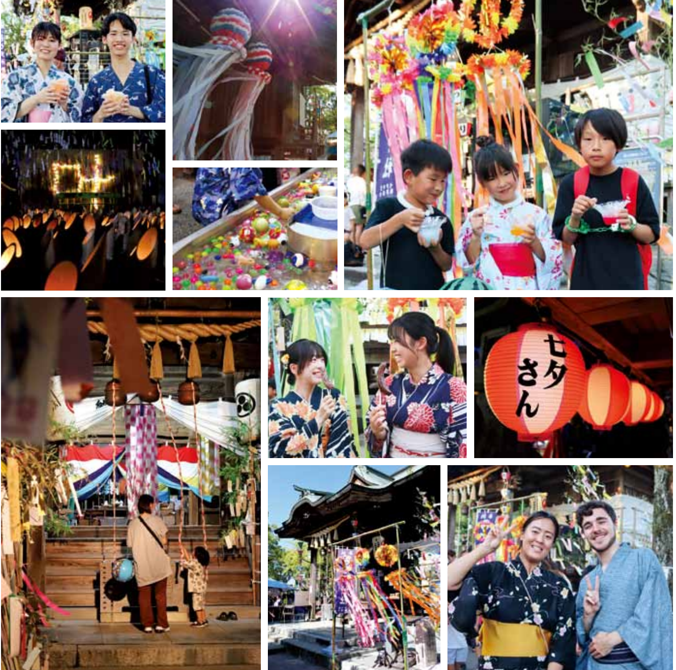
8月7日、七夕神社の夏祭り