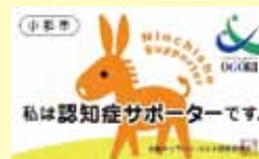
認知症サポーター養成講座の受講者に提供するカード