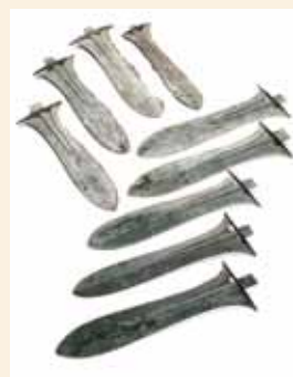
寺福童遺跡・銅戈

寺福童遺跡から出土した県指定有形文化財。当時の集落から遠く離れた穴の中に、並べた状態で埋められていました。当時の人たちがどのように埋めたのか分かる貴重な発見例です。