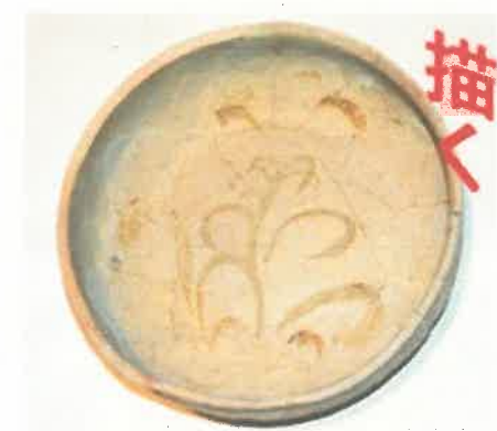
鉄絵花卉文盤（朝倉市才田遺跡出土）宋代・12世紀