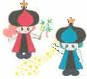
小郡市観光大使 オリリン・ヒコロリン