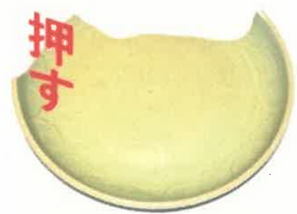
青磁印花文盤（太宰府市金光寺跡出土）明代・15世紀