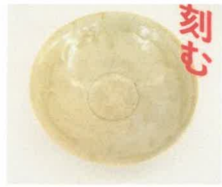
白磁刻花文碗（伝佐賀県出土） 宋代・12世紀