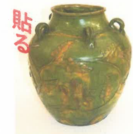
下：三彩貼花文壺（個人蔵） 明代・16世紀