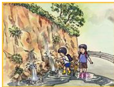
がけから水が湧き出ている。