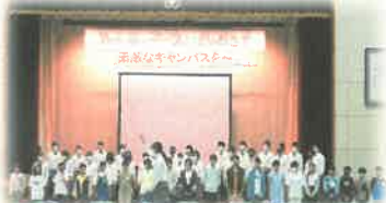
〈立石安心プロジェクト〉 生活科・総合カリキュラム