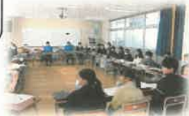
「立石の未来を語る」 小中合同リーダー研修会

『くろつちカリキュラム』とは… 立石の地域のよさや特色を生かした小中学校の教育内容を、子どもの心身の発達に応じて編成する、小中9年間を一貫させた教育計画のことです。 ○義務教育9年間を前期（小1～小4）・中期（小5～中1）・後期（中2～中3）の3区分の節目を設け学校の教育計画を工夫します。 ○「教科カリキュラム」「生活科・総合的な学習の時間のカリキュラム」「人権カリキュラム」の3つの柱で構成し、バランス良く知・徳・体を育成します。 ○地域と協働して、生活科・総合的な学習の時間の充実を図ります。具体的には、油屋やくろつち会館見学、郷土料理や伝統工芸体験などのゲストティーチャーとしてサポートしてもらいます。