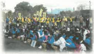
〈立石ウォークラリー〉 地域行事