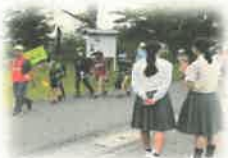
〈小中合同あいさつ運動〉 児童会・生徒会活動