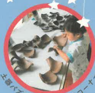
土器パズルなど子ども向けコーナー

毎年6月初め頃は当館敷地内でホタルが目撃されています。運が良ければイベント中にも逢えるかも…!?