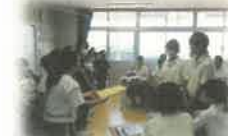
「外国語活動での授業交流」 教科カリキュラム