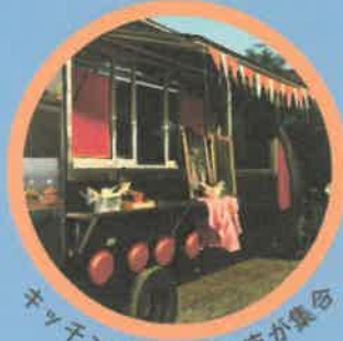
キッチンカーなど出店が集合