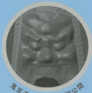
境瓦モニュメント初公開