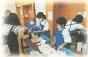
「校区盛り上げ隊プロジェクト」 生活科・総合カリキュラム