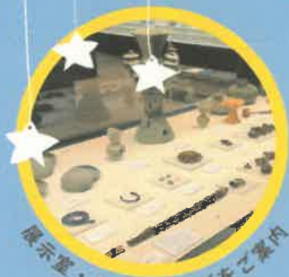
展示室・バックヤードをぶらぶら