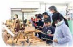
おこおりしょう 小郡小アンビシャス

地域の大人たちが見守る、子どもたちが自由に過ごせる居場所です。市内9カ所のアンビシャス広場で、放課後や休日等に一緒に遊んだり、話をしたり、学習をしたりするなどの活動を通して、地域で子どもたちを育てています。