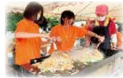
のぞみ・いきいき アンビシャス