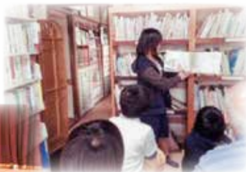
しょうがくせい 小学生による読み語り

また、親子のふれあいや高齢者との親睦の場を提供し、地域社会の交流の場にもなっています。