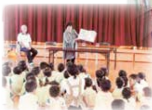
保育園での読み語り