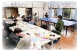
ひらき しんまち 開・新町アンビシャス