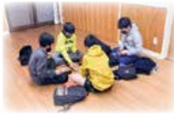
こいたい おおさき 小坂井・大崎 アンビシャス