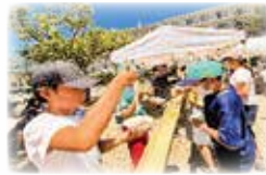
みどりく 緑区アンビシャス