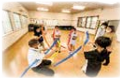
てらふくどう 寺福童アンビシャス