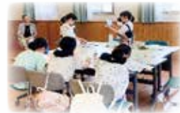
みくにっこアンビシャス