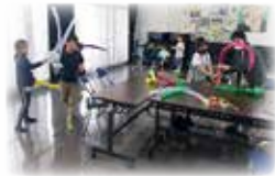
小坂井2アンビシャス