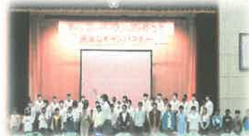
〈立石安心プロジェクト〉 生活科・総合カリキュラム