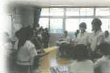
「外国語活動での授業交流」 教科カリキュラム