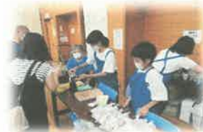
「校区盛り上げ隊プロジェクト」 生活科・総合カリキュラム