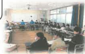
「立石の未来を語る」 小中合同リーダー研修会