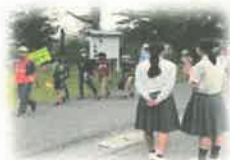
〈小中合同あいさつ運動〉 児童会・生徒会活動