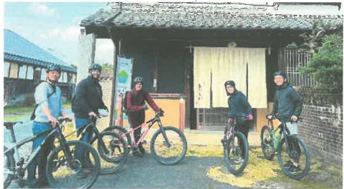
お得なクーポンを持って自転車で飲食店へ

今回はスタンプラリー最終日に、市観光協会と九州歴史資料館とのコラボイベントのほか、キッチンカーも登場します。