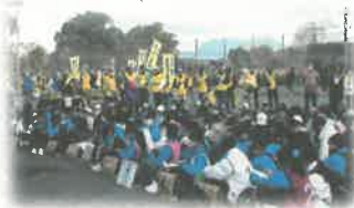
〈立石ウォークラリー〉 地域行事