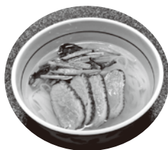
鴨と魚介出汁のフォー