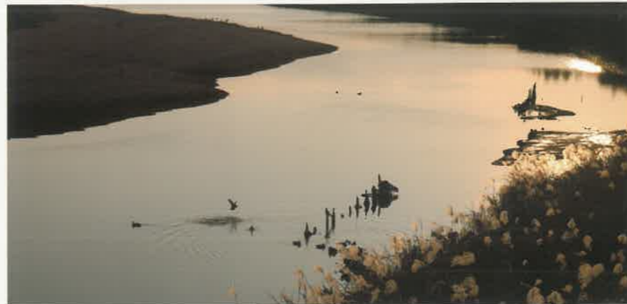
夕日に照らされた宝満川から飛び立つ鴨

しかし、今でも冬のため池や宝満川では、鴨がゆったりと泳ぐ景色が見られます。夕日に照らされたこの美しい情景、そしてそれにまつわる歴史や文化は、小郡ならではのものです。