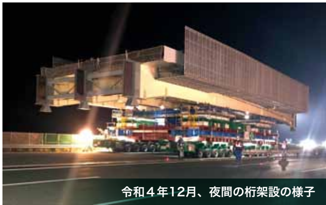
令和4年12月、夜間の桁架設の様子