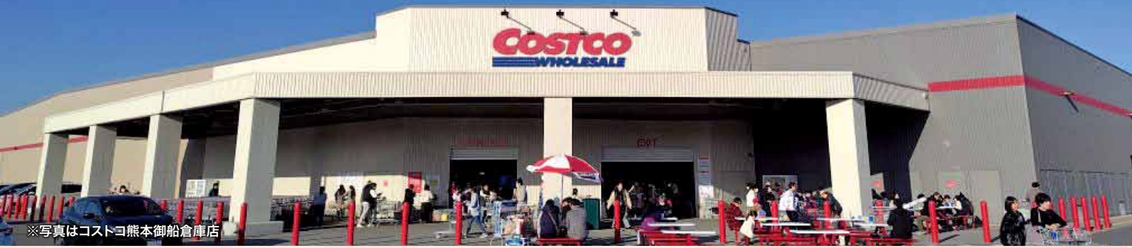
※写真はコストコ熊本御船倉庫店