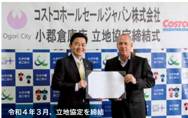
令和4年3月、立地協定を締結

市は、すでに策定している筑後小郡インターチェンジ周辺のまちづくり構想により、住宅地・農業・教育・文化・歴史などと調和の取れた魅力創出を図り、構想区域にとどまらず、市内全体への活性化へとつなげていきます。