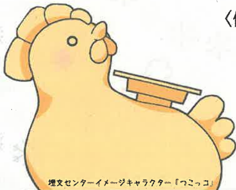
埋文センターイメージキャラクター「っこっコ」

〈例題〉 なんぼくちょうじだい 南北朝時代に おごおり 小郡で行われた「 おおほばる かっせん 大保原合戦」で たたか 戦った人物として、まちがっているものは