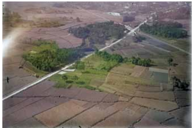
▲カラー画像化した小郡町