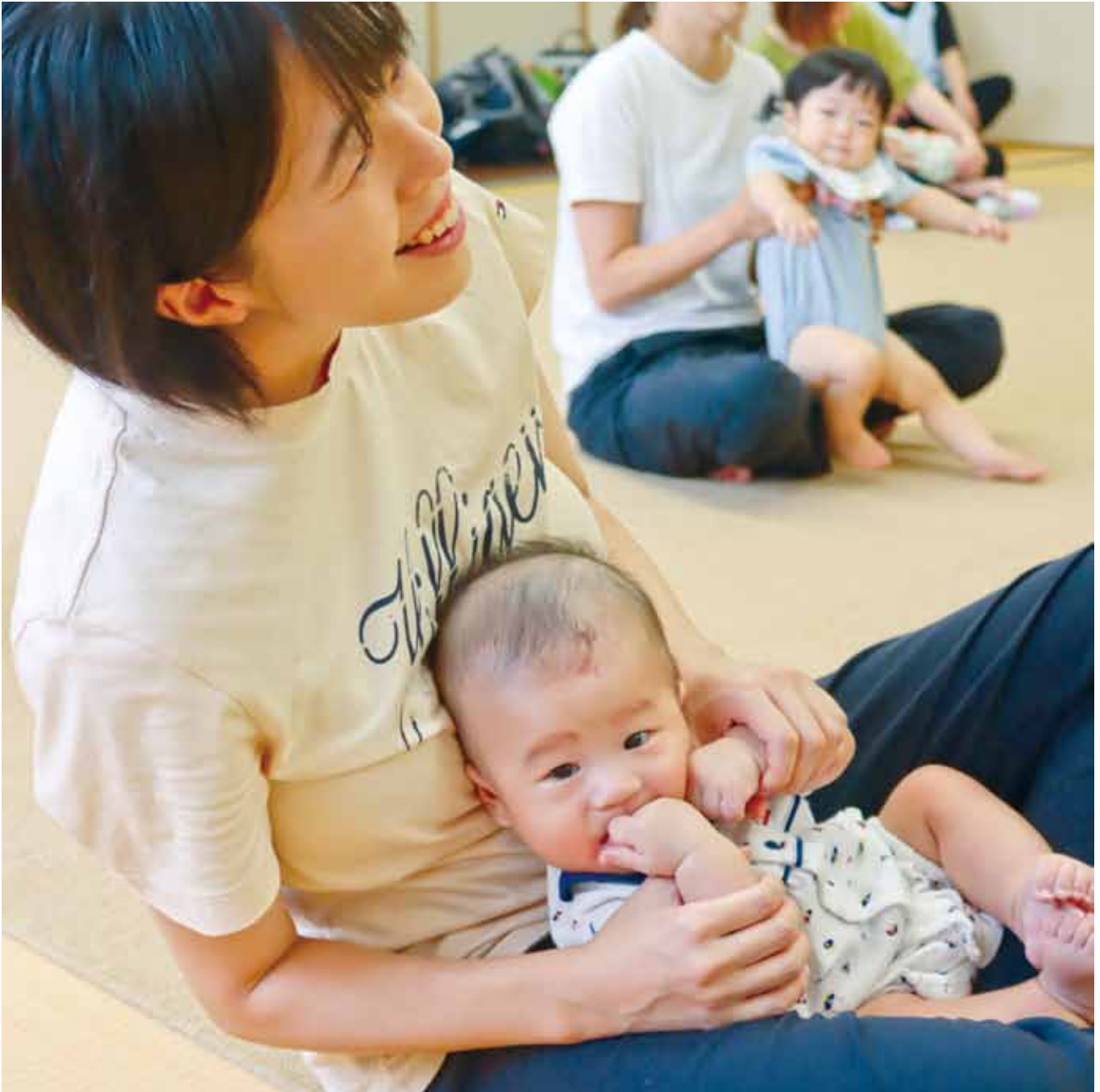
つどいの広場ぼかぼか(親子でエクササイズ)