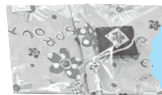
携帯用ホワイトボード