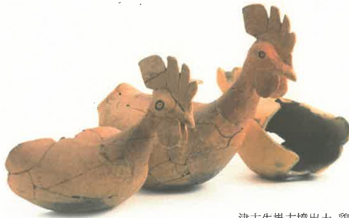
津古生掛古墳出土 鶏形土製品

この講演では、津古生掛古墳と邪馬台国の時代、三国の鼻1号墳とヤマト政権の全国支配、花聳古墳と朝鮮半島の戦乱・鉄資源とのかかわり、横隈山古墳の埴輪が物語る倭の五王の時代について考えます。