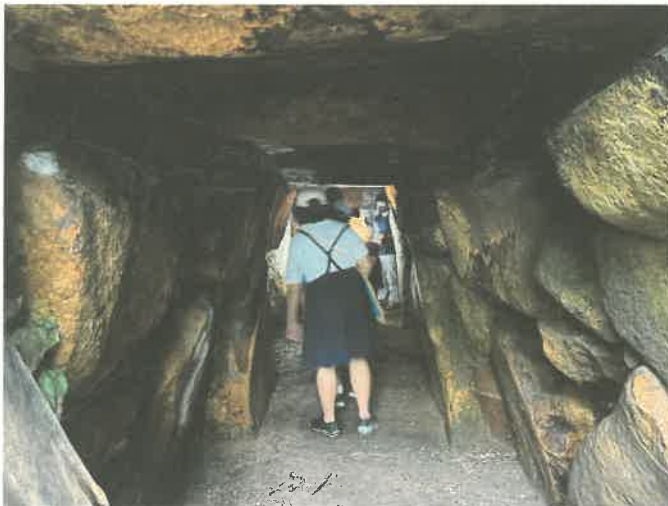
花立山穴観音古墳（県指定史跡）の石室に入る様子