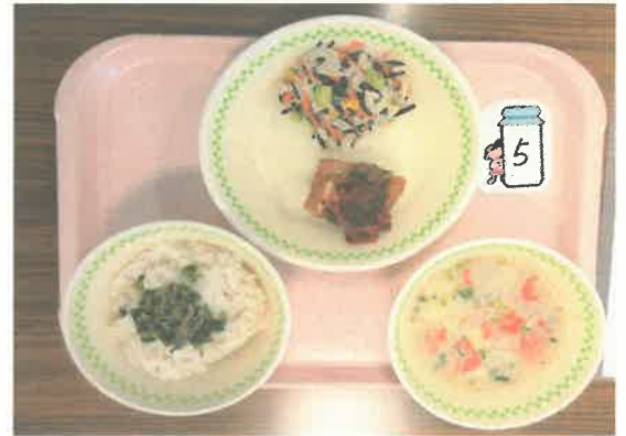
コンクールの作品

麦ご飯、鯔のから揚げトマトうめえ～ソース、 七夕枝豆とひじきのマヨサラダ、豆乳たんたんスープ、 小郡産小松菜としらすのふりかけ、牛乳