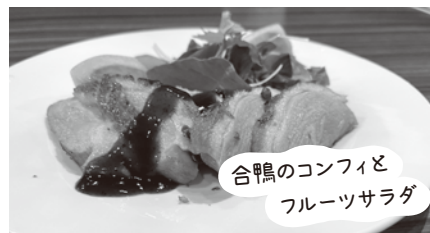
合鴨のコンフィと フルーツサラダ