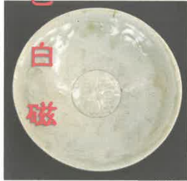
下:白磁櫛描文碗(宋時代:伝佐賀県出土【福建・広東系】)