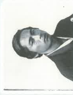
たかまつりょうじんをしらべる (150年くらい前)