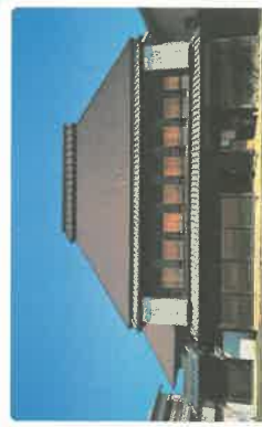
はたごあびらやをしらべる (160年くらい前)