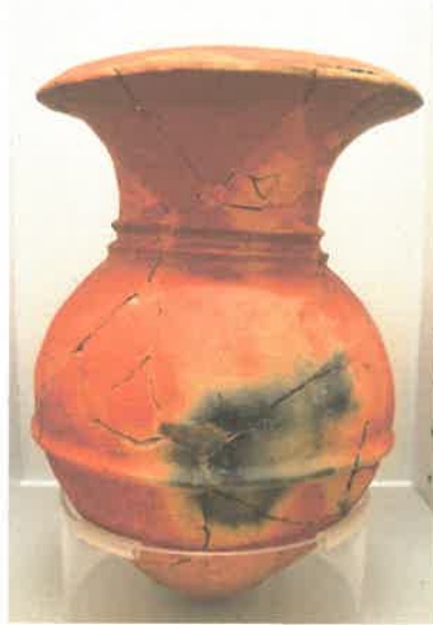
上:壺(弥生時代:糸島市三雲遺跡)