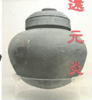
下:有蓋壺(古墳時代:須恵町乙植木古墳群)