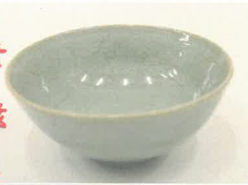
上:青磁貫入碗(宋時代:朝倉市才田遺跡【龍泉窯】)