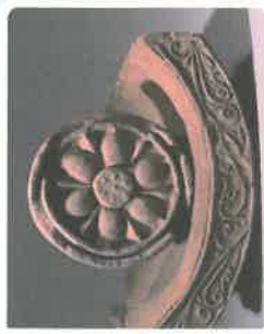
かわらせいらべる (1300年くらい前)