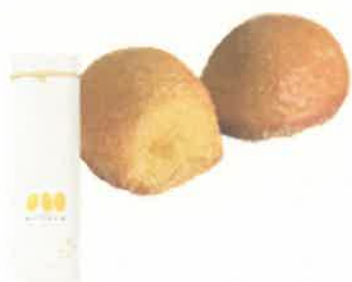
饅頭 レモンケーキ