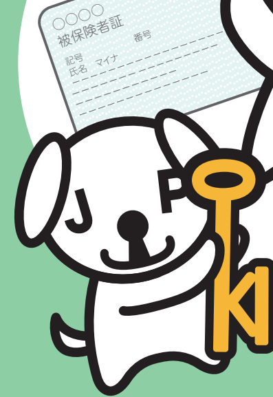
マイナンバー-PRキャラクター マイナちゃん