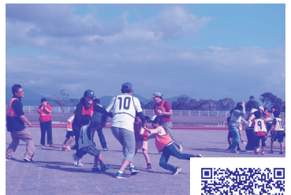
グリーンパーク みんなであそぼう