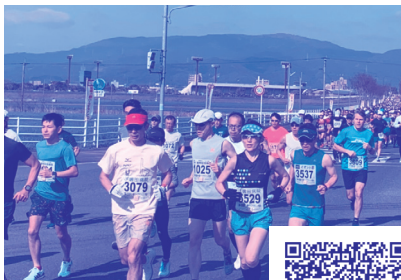
福岡小郡 ハーフマラソン