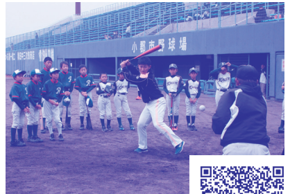
福岡ソフトバンクホークス による野球教室