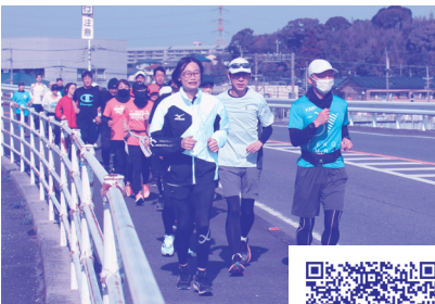
マラソン 1dayレッスン