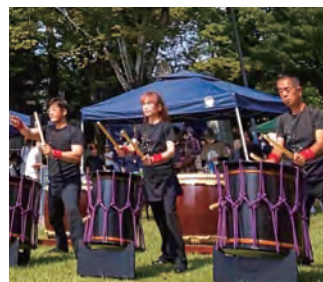
太鼓演奏(雨天時中止)