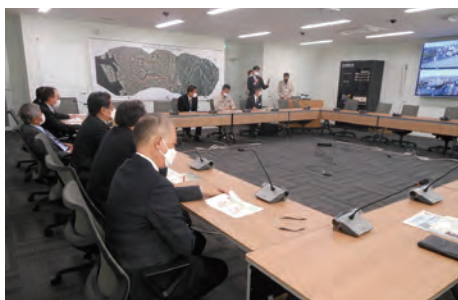
▲新庁舎整備事業について (貝塚市)

担当職員の方から防災拠点機能や省エネルギー仕様等の様々な設備や機能を聞くにつけ、よく練り上げられた利便性の良い庁舎だと感じました。