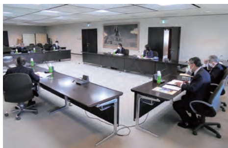
▲まちづくり協議会の現状について (加西市)

まず、令和2年11月にプロジェクトチームでの検討を開始。令和3年度には①相談・支援窓口の設置②身近な方々への理解の促進③交流と情報交換の場の設置の3つ施策を実施しています。特に①の窓口設置は全国初。当事者等の相談を受け、支援の調整を担う窓口を設置。この支援の調整が縦割り行政への