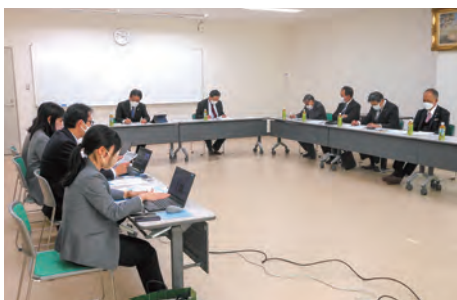
▲夜間中学校と不登校対策について (三豊市)

令和4年度から、既存中学校に「二部学級」として夜間中学校を開設しています。高瀬中学校は三豊市でも一番新しい学校のように、十分な広さと機能を兼ね備えた校舎で、市内の中心部で駅も近く立地も良いところ