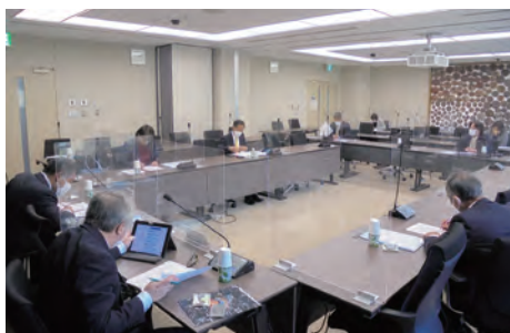
▲ヤングケアラー支援の推進事業について (備前市)

とを始めたわけではなく、従来からの支援をどう繋げていくのか、その端緒を学ぶことができた視察でした。