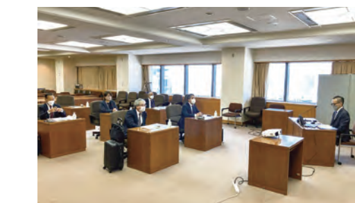
▲子ども・若者ケアラーへの支援事業の現状と取組について (神戸市)

現代の日本社会には、このような誤った情報を信じ込み、差別感情を増幅させる構造があります。これを解決するためには、寝た子をおこすのではなく、正しい情報を伝え人権意識を高める教育・啓発に一層注力する必要性を感じました。 現代の日本社会には、このような誤った情報を信じ込み、差別感情を増幅させる構造があります。これを解決するためには、寝た子をおこすのではなく、正しい情報を伝え人権意識を高める教育・啓発に一層注力する必要性を感じました。