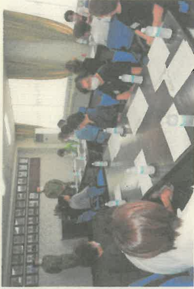
駐屯地司令挨拶及び部隊長等の紹介