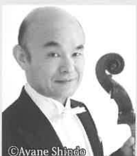
菊地 知也 Tomoyota Kikuchi 日本フィルハーモニー交響楽団 ソロチェリスト