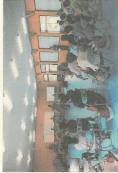
駐屯地音楽部演奏