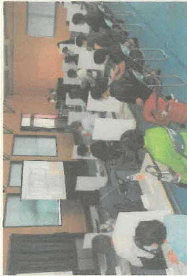
駐屯地及び第5施設団等の概要説明