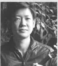
長石 篤志 Atsushi Nagaiishi ヴィオラ奏者