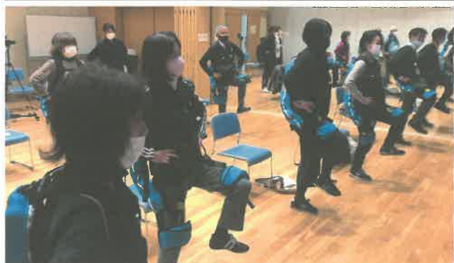
コミュニティセンター職員 体験模様