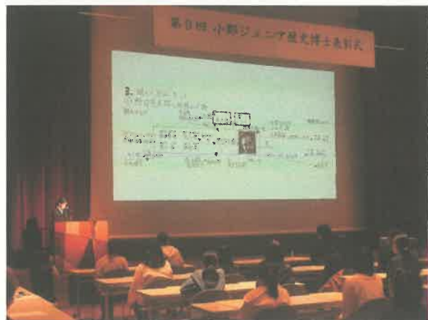
表彰式でプレゼン発表する生徒(令和3年度)