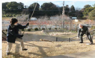
モグラ打ちの様子

一月十四日の早朝に「パーン」という音が聞こえたことはありませんか。これは棒で地面を叩いてまわる「モグラ打ち」という伝統行事です。 モグラ打ちは小正月の頃（多くは一月十四日）に行われ、「十四日のモグラ打ち、軒だれ、こきだれ、こき回せ」と掛け声をかけながら、長さ三メートルほどの棒（竹の先を折り曲げ、その部分をワラで包んだもの）で家先の地面や畑を強く叩いて高い音を響かせ、田畑を荒らすモグラを追い払います。叩き終わった棒は、