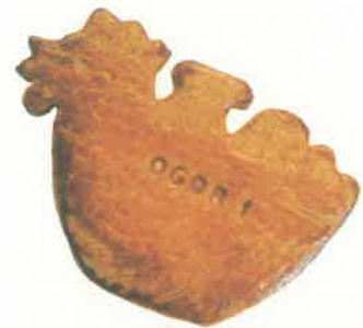
つこっこクッキー