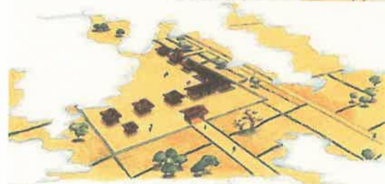
右上：上岩田官衙遺跡復元予想図 左下：下高橋官衙遺跡復元予想図

問合せ先 担当課：文化財課 担当者名：大城・岡田 連絡先：0942-75-7555