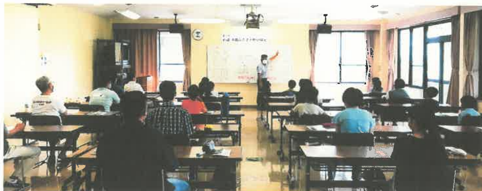
第7回前期検定の様子(埋文センター)