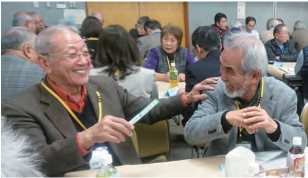
気の合う仲間とのおしゃべり