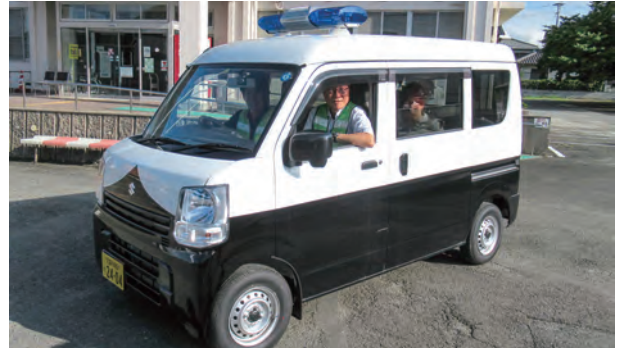
登下校時の防犯パトロールや見守り