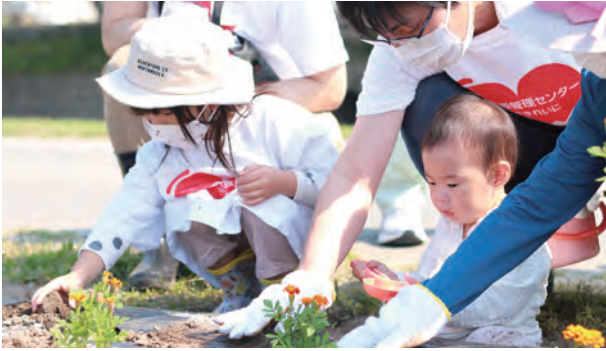
地域の清掃や景観維持活動