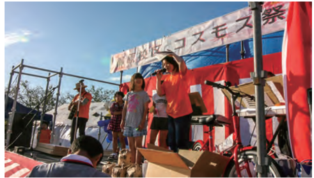
夏祭りなどの交流イベント