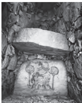
▶竹原古墳の壁画(宮若市)