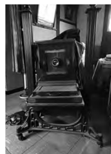
使われていたカメラ▲