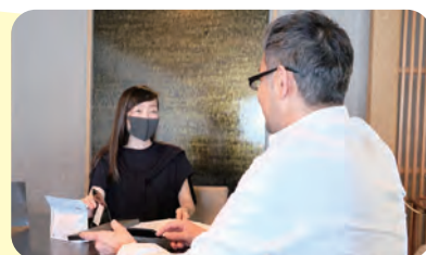
▲定期的に行う返礼品事業者との情報交換

特長は、返礼品事業者との距離の近さ。専属の担当者がしっかりコミュニケーションをとることで、ちょっとした困りごとに対応したり、寄附者をつかむエピソードを引き出したりと、返礼品を通じた小郡市の魅力の発信につながっています。