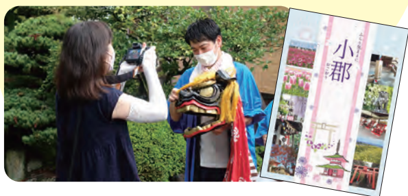
▲七夕神社の獅子追いを取材