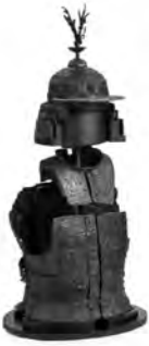
▶ 国の重要文化財の冑と甲冑(行橋市稲草古墳)