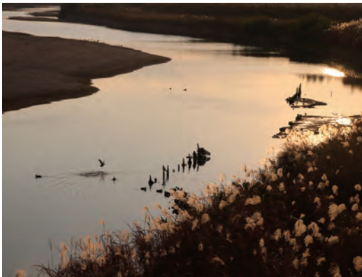
夕日に照らされた宝満川から飛び立つ鴨

しかし、今でも冬のため池や宝満川では、鴨がゆったりと泳ぐ景色が見られます。夕日に照らされたこの美しい情景、そしてそれにまつわる歴史や文化は、小郡ならではのものです。