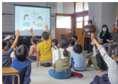
各小学校区で1人の人権擁護委員が活動しています