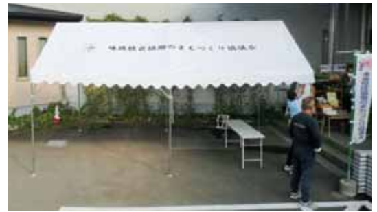
▲整備した備品を使用して『あじっこ市場』を開催