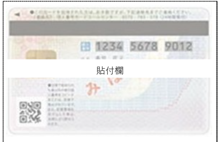
マイナンバーカードの表面のコピー