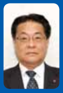
田中 雅光 (公明党)