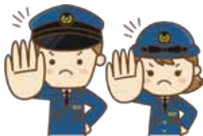
小郡警察署管内の犯罪・交通事故の発生状況 (令和3年3月末現在)