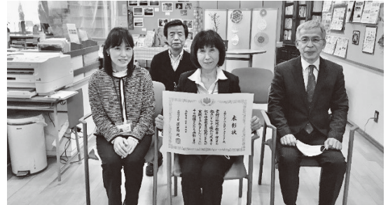
のぞみがおか生楽館の職員の皆さん

これからも地域の人々の「居場所」として集える場所、自分の経験や力を生かせる場所として、いつでも誰でも自然とつながることができるような施設づくりをめざしていきます。