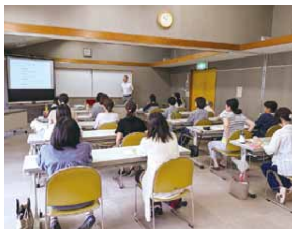
▲令和元年度の講座の様子