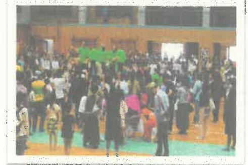
校区最大の参加がある「地域文化祭」