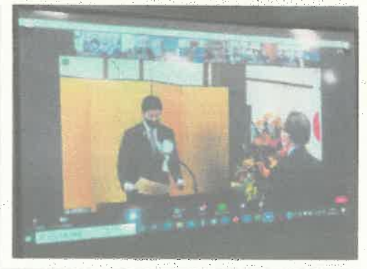
▲令和3年2月25日オンライン表彰式の様子