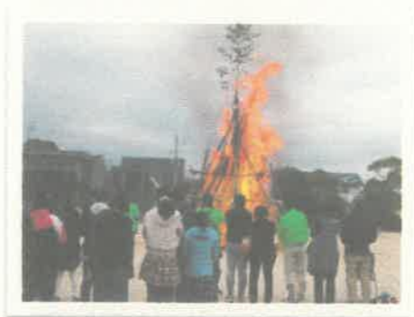
小学校校庭でのどんど焼きの様子