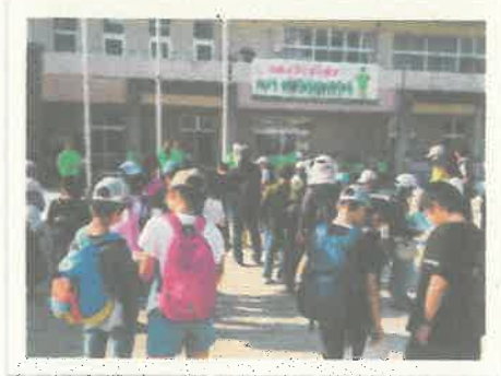
地域を巡るウォークラリー大会