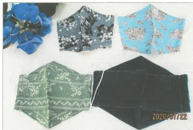
「ワークショップ虹」のマスクはデザインのバリエーションも豊か

マスク料金：大人用 1枚 300円 子ども用 1枚 250円 営業時間：月～金（祝休日除く） 9：30～16：00 住 所： 小郡市小郡1095-1 電 話： 0942-73-5212