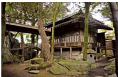
市指定文化財 平田家住宅

市長―小郡校区の皆様から、平田家を中心に様々なルートの開発や観光ガイドの育成などたくさんアイデアをいただきました。歴史資産を積極的に活かしていくこうとする市民の皆様やNPO法人の主體的な取り組みが大きな鍵となりますが、行政として積極的に支援します。