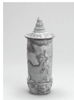
白磁経筒 伝四王寺山出土 京都国立博物館所蔵

11世紀後半から12世紀にかけて、仏教を信仰した人々が危機的な時代に「救い」を求めて、経典を筒に収めて塚に埋納する「経塚」を造営することが流行しました。福岡は、経塚造営の一大中心地であり、本展では借用中の京都国立博物館所蔵品と当館所蔵品などを中心に、経筒や外容器を展示します。